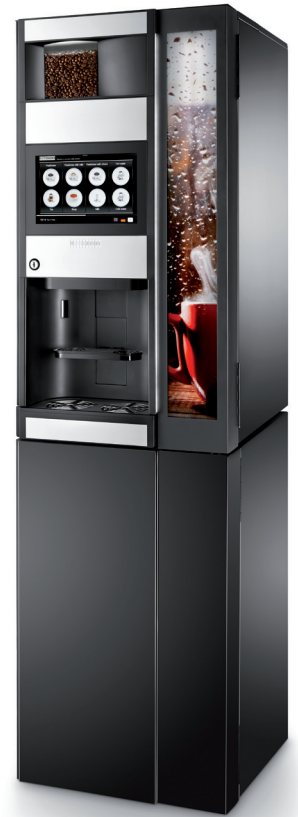
Der elegante Unterschrank passt perfekt zum Design der Maschine.