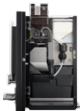
OB 2 (XL) NG