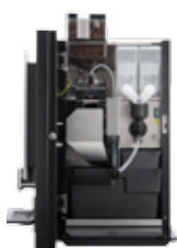
OB 3 (XL) NG