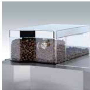
+ Frische Kaffeebohnen